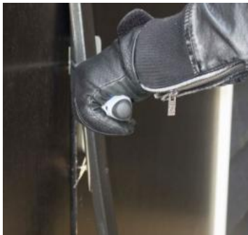
Afdek van hout